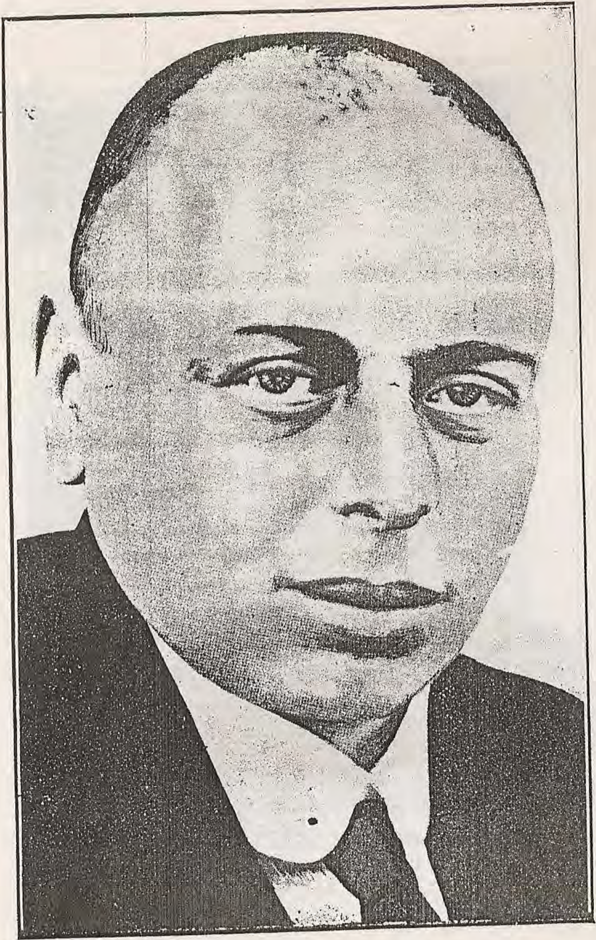
O monstro judaico Bela-Kun.