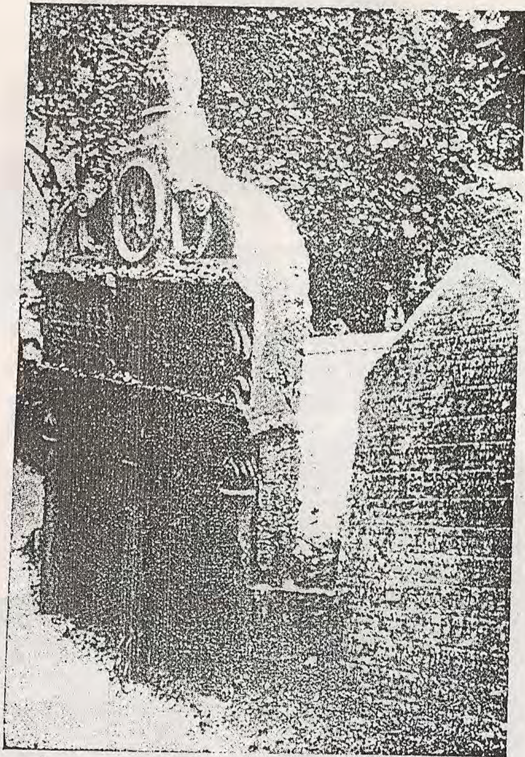
O famoso tumulo do Rabino Miraculoso no cemitério de Praga.