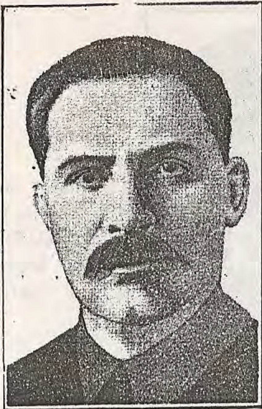
O judeu Lazaro Kaganovitch, ex-sogro de Stalin, chefe da Oligarquia Kaganovista da Rússia.