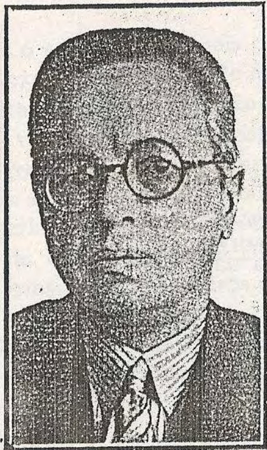
O judeu Stein, embai- xador dos Sovietes.