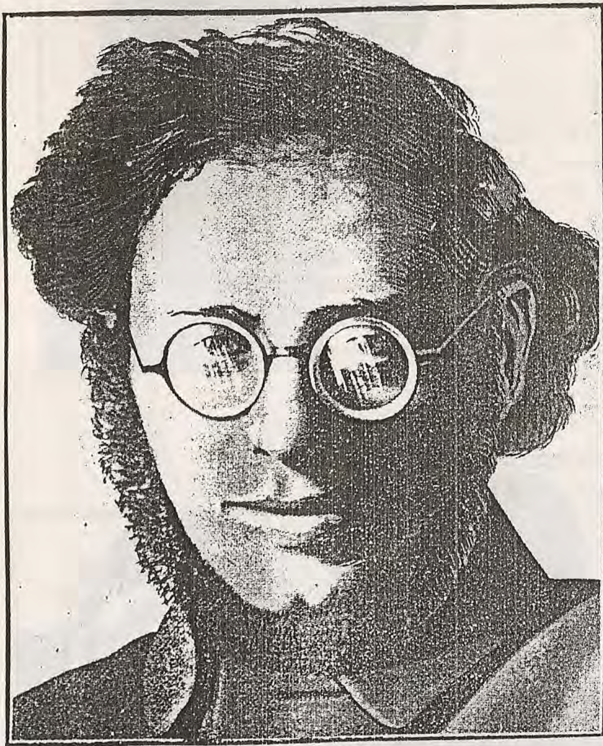
O judeu Sobelsohn, vulgo Radek.