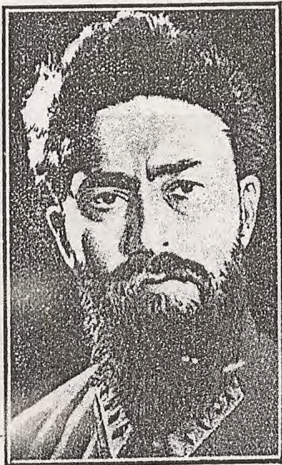
O judeu Gamarnik